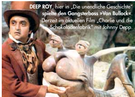
DEEP ROY, hier in „Die unendliche Geschichte“ spielte den Gangsterboss »Van Bullock«. Derzeit im aktuellen Film „Charlie und die Schokoladenfabrik“ mit Johnny Depp.

seitigkeit. Nicht nur, dass er inzwischen Millionen Schallplatten verkauft und für andere Interpreten erfolgreich komponiert hat, er präsentiert sich auch in körperlicher Topform und macht deutlich, dass er