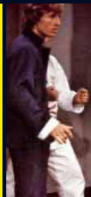
THOMAS – unfair